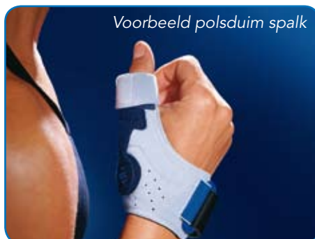
Voorbeeld polsduim spalk

Als de niet-chirurgische behandeling niet het gewenste effect geeft, kan in sommige gevallen operatieve behandeling worden overwogen.